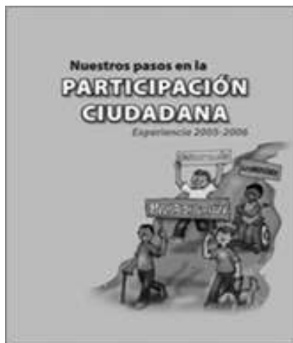
Figura No. 04. Portada de la publicación del CNREE: "Nuestros pasos en la participación ciudadana. Experiencia 2005-2006" del año 2007.

Descripción: Portada de la publicación arriba citada. En ella se pueden apreciar cuatro personas de ambos sexos, con diversos tipos de discapacidad que avanzan mientras sostienen tres pancartas en las que se leen las palabras: "Capacitación", "Liderazgo" y "Participación". Puede consultar esta publicación aquí