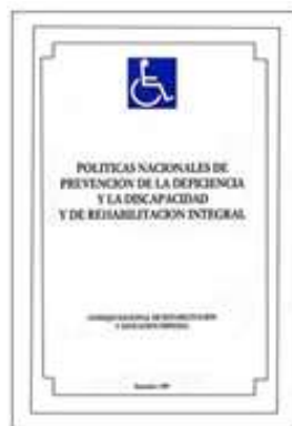
Figura No. 01. Portada de las Políticas Nacionales de Prevención de la Deficiencia y la Discapacidad y de Rehabilitación Integral, 1989.

Descripción: En la imagen aparece la portada original del documento, la cual data del año 1989. Dicha portada está compuesta por: El símbolo internacional de la accesibilidad que se utilizaba en esa época (persona en silla de ruedas), el título completo de las políticas y en la parte inferior, se puede leer: Consejo Nacional de Rehabilitación y Educación Especial, setiembre 1989.