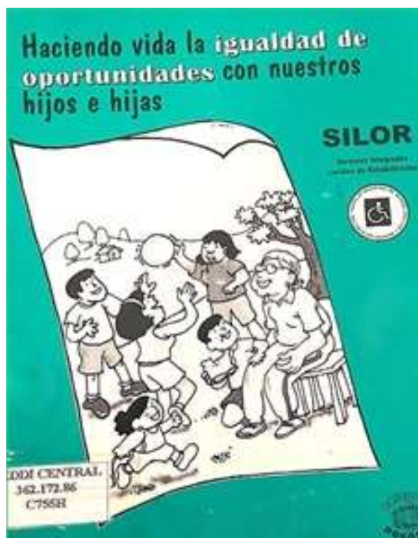
Figura No. 02. Portada de publicación del año 1996 del SILOR Naranjo del CNREE

Los SILORES funcionarían bajo la denominación y esquema de trabajo arriba descritos, hasta inicios de la década de los años 2000, época en la que el CNREE adoptó un cambio de modelo de abordaje regional, como se verá en el recuento histórico correspondiente a esos años.