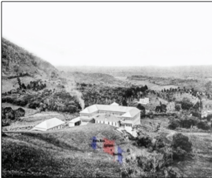
Impresionante vista del Lazareto Las Mercedes, también conocido como Sanatorio Las Mercedes, el cual estuvo localizado entre San José y Cartago. Se trataba de un asilo para personas leprosas o, como también se les llamaba, lazarinos.