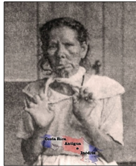
Año 1912. Mujer muestra sus manos en donde se puede apreciar la caída de sus dedos debido a la lepra. Fotografía y texto tomados de: Costa Rica Antigua e Inédita. Comunidad en Facebook.