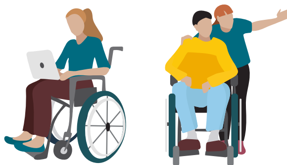
Personas con discapacidad usuarias de silla de ruedas socializando.