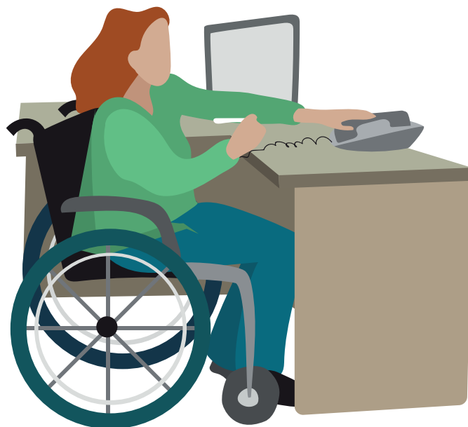
Persona usuaria de silla de ruedas atendiendo el teléfono, en una oficina.

Es el derecho de todas las personas con discapacidad a construir su propio proyecto de vida, de manera independiente, controlando, afrontando, tomando y ejecutando sus propias decisiones en los ámbitos público y privado.